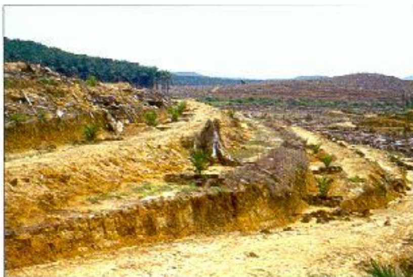
Teres perlu dibuat mengikut spesifikasi untuk mendapatkan kesan yang positif