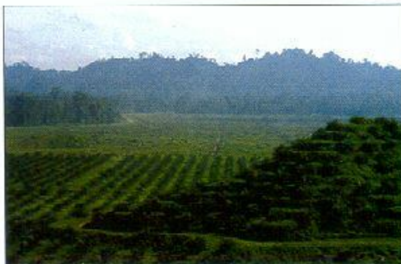
Kepadatan yang optimum menentukan potensi tanah di eksplorasi sepenuhnya

Rekabentuk ladang juga akan mempengaruhi kepadatan sawit. Unsur-unsur seperti jalan pertanian, parit dan teres akan menentukan kepadatan. Lebih banyak unsur-unsur tersebut dibina maka semakin rendahlah kepadatan tanaman di kawasan berkenaan. Sebagai contoh kawasan berbukit memerlukan jalan yang lebih banyak berbanding dengan kawasan rata (Jadual 1).