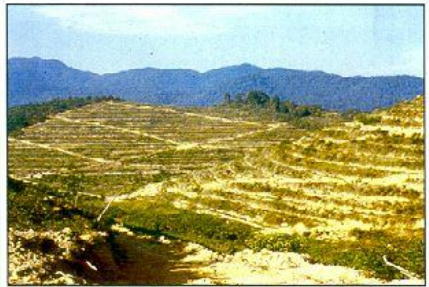
Jalan pertanian yang sistematik di kawasan bukit boleh meningkatkan efisiensi perhubungan

sepadat-padatnya supaya teres lebih kukuh dan mengelakkan berlakunya hakisan .