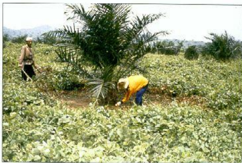
Penanaman berkualiti penting untuk menjamin kemampanan dan kesejahteraan industri sawit