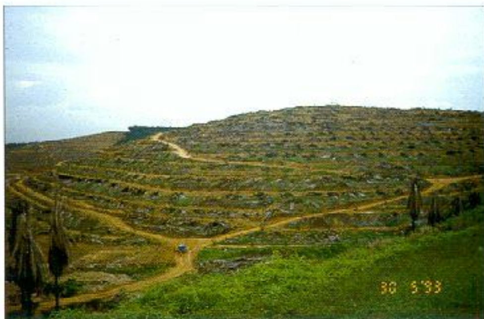
Untuk mendapatkan kepadatan optimum di kawasan bukit memerlukan pengelahuan, kemahiran dan pengalaman

yang akan diperolehi daripada bidang usaha yang diceburi. M u n g k i n pengusaha ingin mendapatkan kombinasi yang terbaik umpamanya dengan mengadakan kombinasi tanaman lain. Ini dapat dicapai melalui tanaman bersepadu ( integrated farming ). I a b o l e h