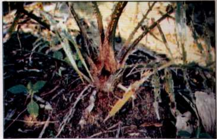
Lubang dari kesan korekan kumbang badak pada pokok yang baharu ditanam