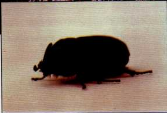
kumbang badak jantan