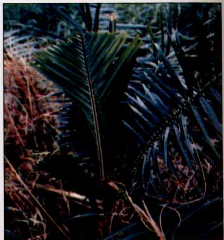
Pelepah yang diserang berbentuk kipas setelah terbuka pada pokok muda

Pokok yang diserang hebat terutama pokok yang muda akan bantut dan boleh juga menyebabkan kematian sekiranya serangan berterusan dan tunas pucuk musnah.