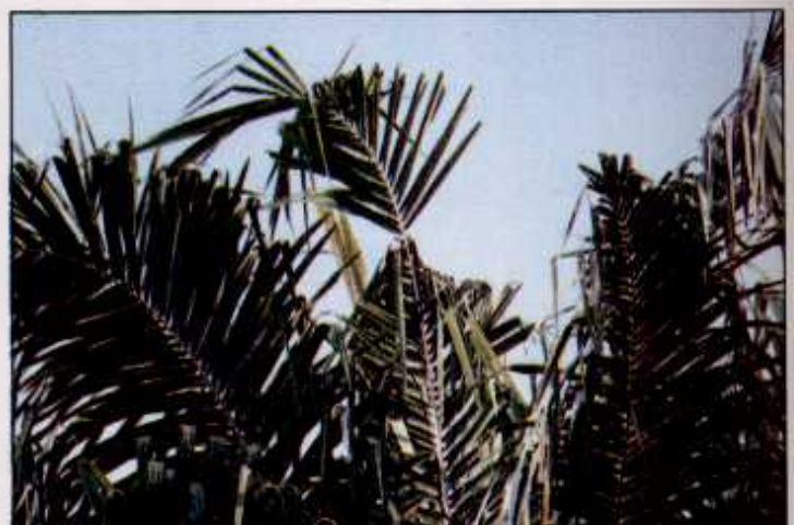
Pelepah berbentuk kipas pada pokok matang >