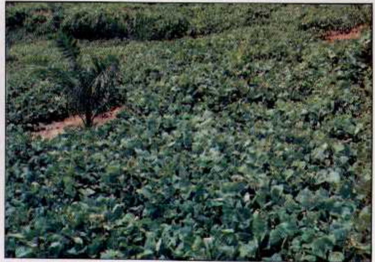
Bukan sahaja menutup tempat pembiakan kumbang badak, kacang penutup bumi membaiki kesuburan tanah dan pertumbuhan pokok kelapa sawit