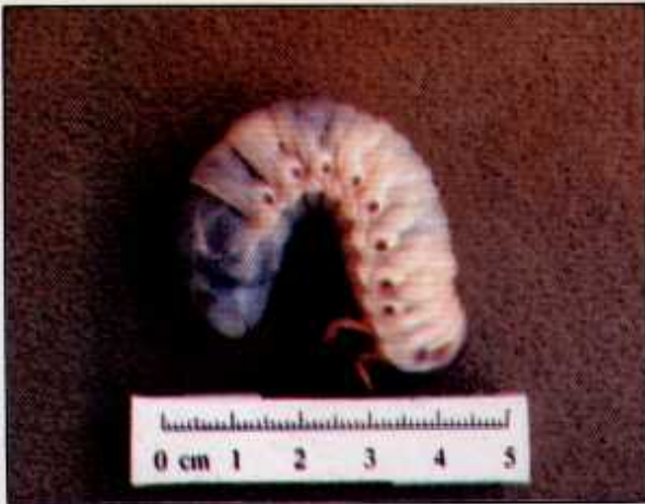
Larva yang tinggal dalam bahan reput seperti tunggul dan batang kelapa sawit yang tumbang