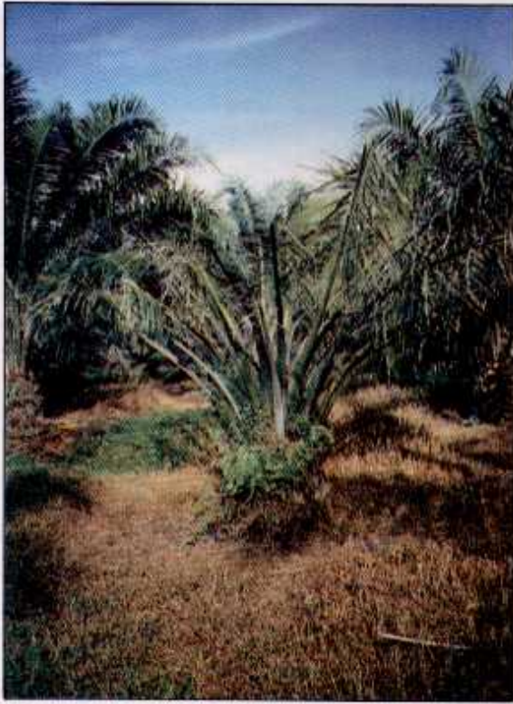
Serangan yang teruk menyebabkan pokok bantut dan menjejaskan pengeluaran buah