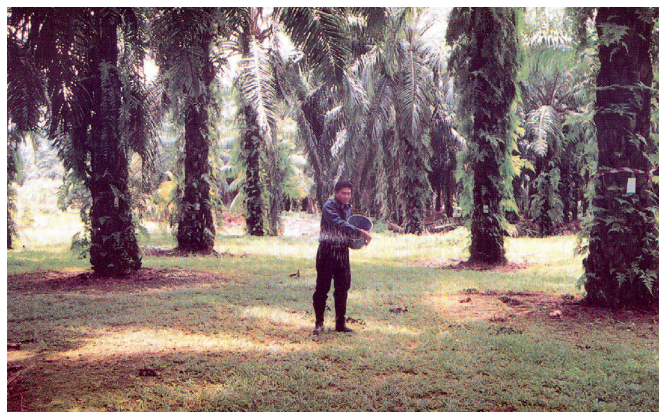
Rajah 2. Baja ditabur di seluruh kawasan pokok matang. Ladang perlulah bebas dari rumput bahaya.

lebar dan sudah terhakis, pekebun boleh menanam baja dengan kedalaman 10 – 15 cm (4-6 inci) di beberapa tempat di keliling kanopi daun. Cara ini adalah lebih baik sekiranya baja ditabur sahaja kerana lebih terdedah kepada hakisan. Walau bagaimanapun, bagi pokok sawit belum matang, kaedah pembajaan yang berkesan ialah menabur baja di bawah kanopi daun.