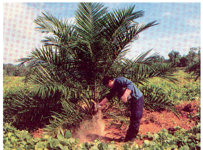
Rajah 1. Baja ditabur pada keliling pokok untuk pokok berumur tiga tahun.

Untuk pokok sawit matang yang berada di atas tapak tanaman ( platform ) yang kecil atau teres yang kurang