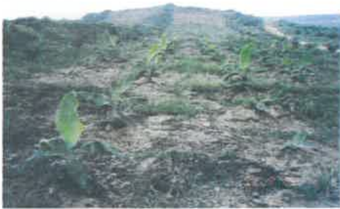
Rajah 5. Barisan tanaman pisang.