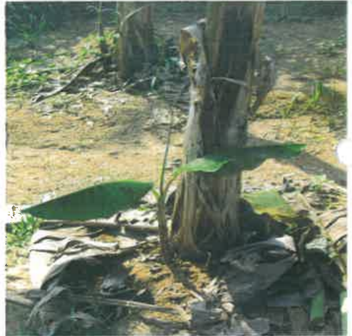
Rajah 4. Sulur payung tidak sesuai sebagai bahan tanaman.

serta berdaun lebar tidak digalakkan untuk dijadikan bahan tanaman kerana mempunyai kualiti yang rendah dan membantutkan proses tumbesaran. Keperluan bahan tanaman bagi sehektar kawasan adalah sebanyak 880 pokok sehektar (Suboh dan Norkaspi, 2005). Penanaman pisang tanduk digalakkan menggunakan bahan tanaman kultur tisu kerana pertumbuhan pokok seragam dan kadar kematian yang rendah.