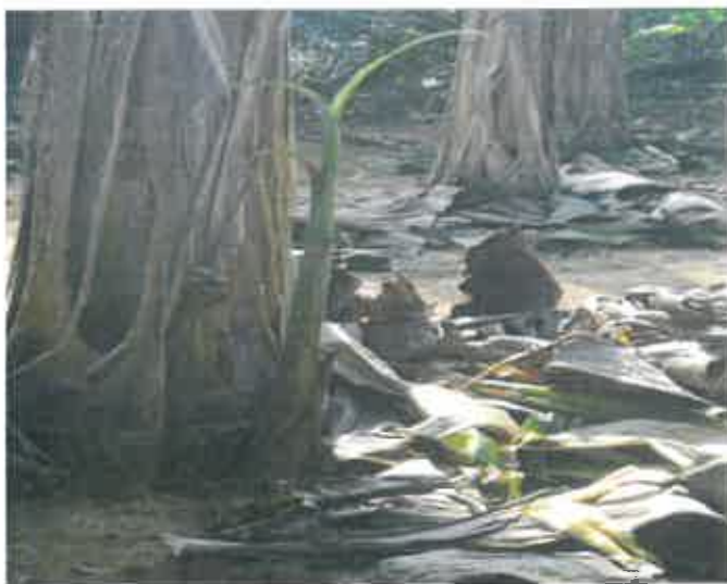
Rajah 3. Sulur pedang sesuai dijadikan bahan tanaman.

Bahan tanaman dari sulur payung ( Rajah 4 ), iaitu yang berumbi kecil, batang yang kecil dan lemah