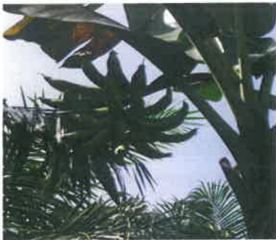
Rajah 1. Tandan pisang tanduk.

Pisang tanduk ( Musa paradisiaca ) adalah sejenis varieti pisang yang sangat dikenali di Malaysia untuk kegunaan sebagai bahan masakan dan kerepek. Buah pisang tanduk ( Rajah 1 ) mempunyai ukuran panjang 25 cm – 40 cm dan lebar 6 cm – 12 cm. Setiap tandan pisang mempunyai satu atau dua