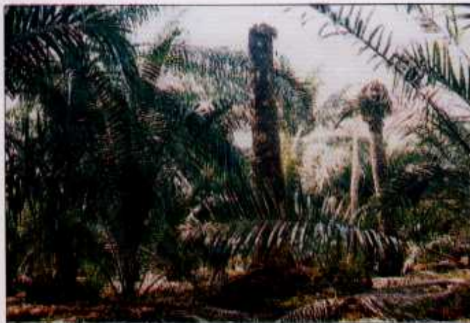
Pokok sawit tua yang tidak ditebang dan dihancurkan akan menjadi tempat pembiakan kumbang badak

Mereka tidak melakukan penjarangan pokok tua mengikut masa dan sistem yang disyorkan kerana perasaan sayang kepada pokok-pokok yang masih berbuah. Oleh itu hanya pokok yang benar-benar tidak berbuah sahaja dibuang.