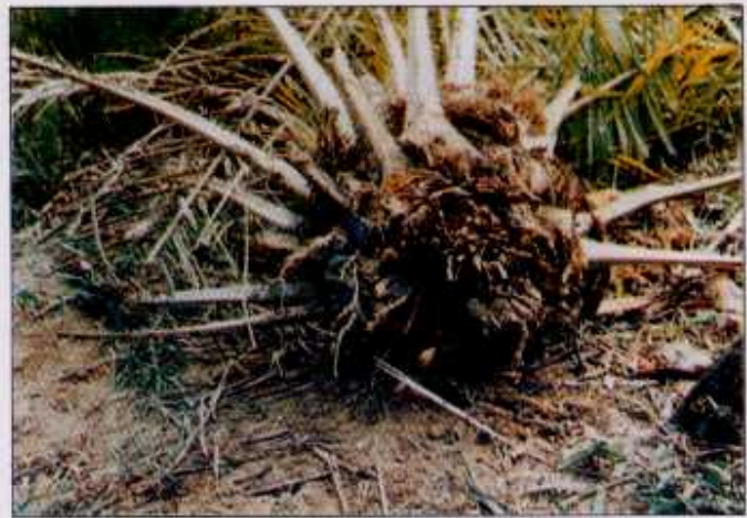
Penyakit reput pangkal batang (Ganoderma) boleh menyerang anak sawit lebih awal

dalam masa 24 hingga 27 bulan (Shamsudin Amit et al. , 1991)