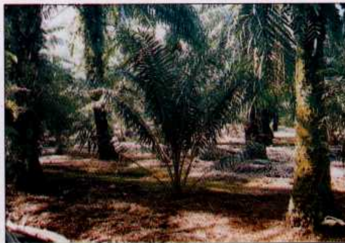
Pokok sawit tua yang lambat ditebang menyebabkan pertumbuhan anak sawit berumur tiga tahun terbantut dan menirus

Risiko pertama yang dihadapi oleh pekebun kecil ialah anak sawit yang ditanam menjadi bantut. Ini adalah kesan daripada tidak mematuhi masa dan sistem penjarangan yang disyorkan iaitu penjarangan 50 peratus selepas enam bulan ditanam dan bakinya diikuti 18 bulan kemudian. Pokok menjadi bantut kerana tidak mendapat sinaran cahaya matahari yang mencukupi untuk memproses makanan. Pokok yang bantut tidak akan mengeluarkan hasil atau mengeluarkan hasil yang sangat rendah.