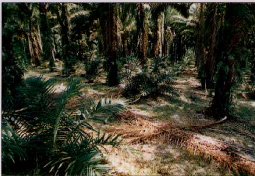
Tanaman bawahan mempunyai risiko yang tinggi sekiranya tidak mengikut amalan yang betul