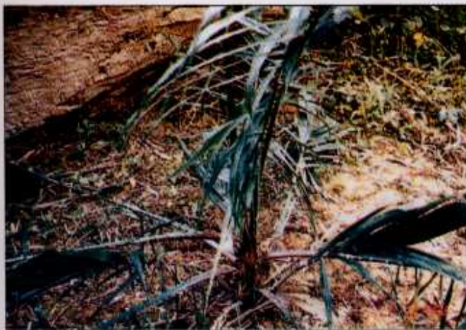
Kesan serangan kumbang badak menjejaskan pertumbuhan anak sawit