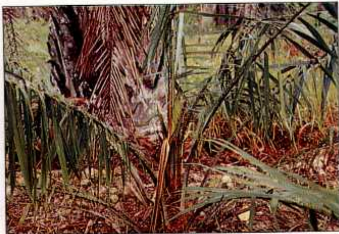
Pucuk anak pokok sawit yang dirosakkan kumbang badak.

Untuk mengatasi masalah serangan kumbang badak ke atas anak sawit yang baru ditanam semula dengan lebih berkesan, ketiga-tiga kaedah kawalan di atas harus digunakan dengan sistematik dan berintegrasi. Oleh itu risalah ini akan membincangkan strategi berkesan ke arah mengawal serangan kumbang badak di kawasan tanam semula sawit yang menggunakan kaedah tanpa pembakaran.