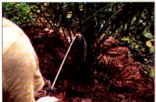
Pengawalan menggunakan racun serangga.

Apabila pokok telah berada antara 10 hingga 12 bulan di ladang dan sekiranya masih terdapat tanda-tanda serangan kumbang badak, penggunaan racun serangga disyorkan. Racun serangga seperti carbofuran ditabur di bahagian pucuk pokok dengan kadar 15-30gm/pokok setiap dua minggu. Jika memilih kaedah semburan, racun serangga seperti cypermethrin disemur di bahagian pucuk pokok dengan kadar 180 ml racun bagi setiap 18 liter tangki semburan (5.0% w/w bahan aktif) setiap dua minggu. Pemilihan racun serangga tidak terhad kepada carbofuran dan