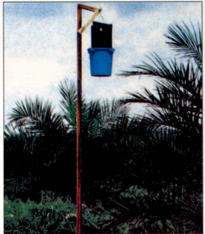
Satu perangkap feromon yang telah siap dipasang.

dua bulan. Perangkap diperiksa dari semasa ke semasa dan kumbang badak yang terperangkap dibunuh. Kaedah ini dapat mengurangkan serangan kumbang badak ke atas anak sawit dan mengelaknya daripada bertelur dan berkembangbiak di dalam tisu sawit yang sedang di dalam proses pereputan. Dengan ini, populasi kumbang dapat dikawal di ladang tersebut. Perangkap feromon ini hendaklah dipasang antara satu hingga dua tahun atau sehingga bilangan tangkapan kurang daripada lima kumbang/minggu/perangkap.