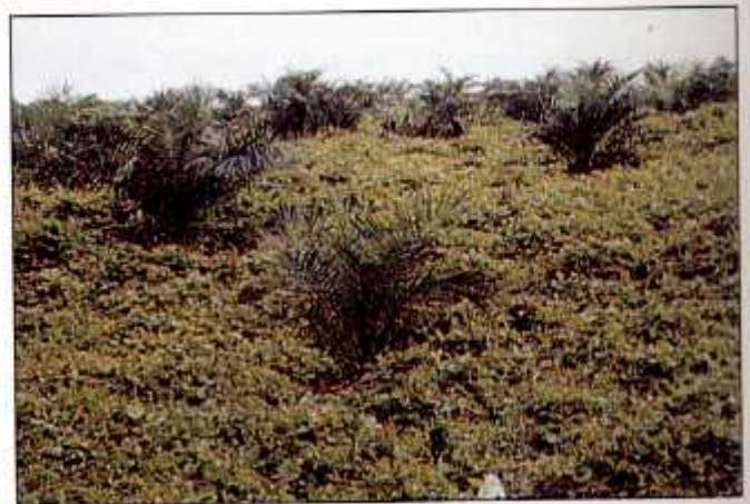
Penanaman kekacang penutup bumi boleh mengawal perkembangan populasi kumbang badak.

kumbang badak. Kacang penutup bumi yang cepat tumbuh dan menjalar seperti Mucuna cochincinensis ditanam secara poket pada jarak satu meter di tepi himpunan batang dan tunggul sawit yang telah diracik. Ini bertujuan untuk menutup himpunan tersebut dengan segera. Strategi ini adalah untuk mengelakkan kumbang badak yang tidak terperangkap ke dalam perangkap feromon bertelur dan membiak di tisu batang sawit ataupun tandan kosong sekiranya digunakan sebagai sungkupan. Dengan cara ini, perkembangan populasi kumbang di dalam ladang tersebut akan menjadi terhad dan dapat dikawal.