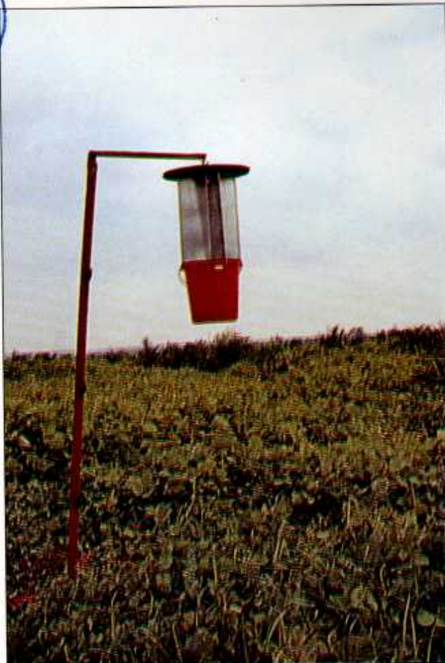
Kawalan menggunakan perangkap feromon.

Kumbang badak dewasa menyerang pokok sawit dengan mengorek pucuknya dan