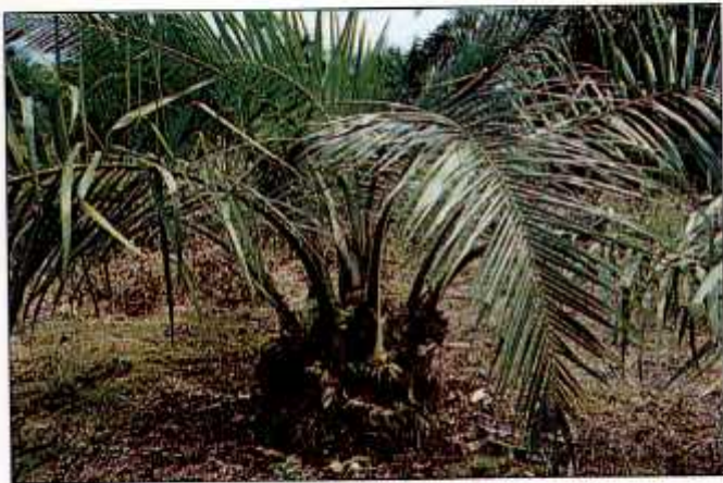
Kesan kerosakan pada pokok sawit muda.