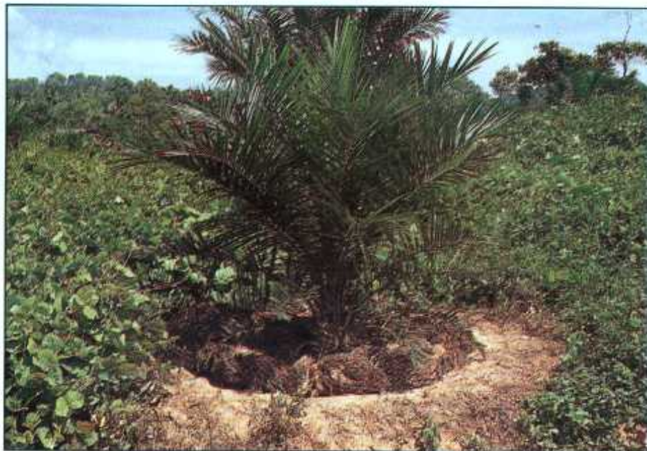
Rumpai terutama di keliling pokok perlu dihapuskan untuk mengurangkan persaingan pengambilan nitrogen oleh pokok muda

Kekeringan daun yang sama juga boleh berlaku pada pokok sawit yang ditanam di atas tanah yang berasid seperti tanah gambut dan asid-sulfat atau pun pokok yang mengalami tegasan air yang teruk. Bezanya