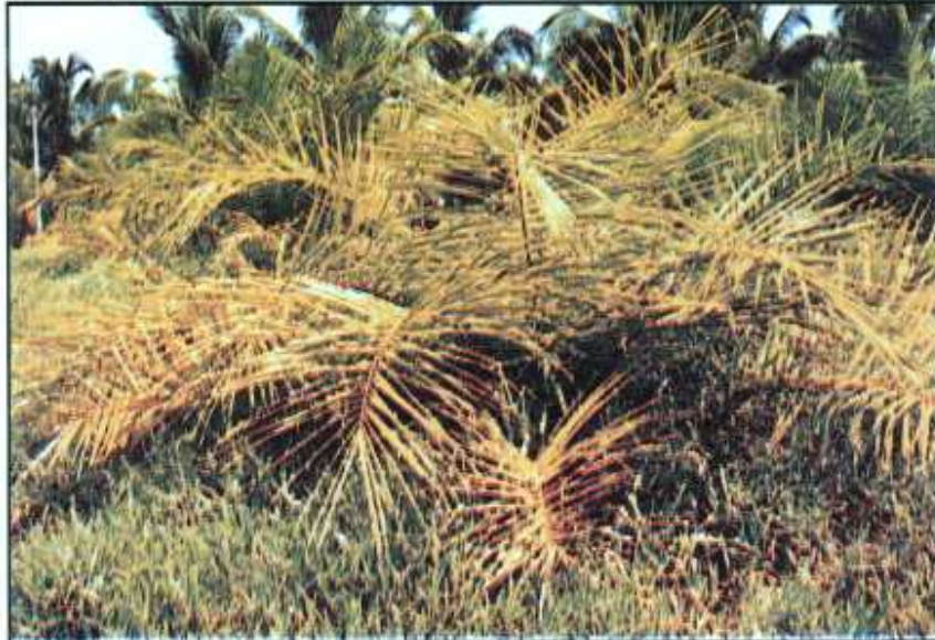
Kekurangan nitrogen-daun berwarna hijau muda/kekuningan dan atas daun kelihatan rata

Kekurangan unsur nitrogen boleh diatasi dengan membekalkan baja yang mengandungi unsur nitrogen seperti amonium sulfat, amonium nitrat, amonium klorida atau pun urea. Sekiranya tanda-tanda kekurangan nitrogen telah nyata, pembekalan 0.1-0.5kg/pokok baja amonium sulfat untuk pokok muda adalah disyorkan. Bagi pokok matang pula, kadar baja amonium sulfat adalah antara 1.0-2.0kg/pokok. Kadar-kadar ini adalah tambahan kepada kadar tahunan baja nitrogen yang telah disyorkan. Baja urea tidak digalakkan untuk tindakan pembetulan disebabkan masalah peruwapan. Halangan disebabkan rumpai yang boleh bersaing dan saliran yang tidak baik atau air bertakung juga perlu diatasi terlebih dahulu.