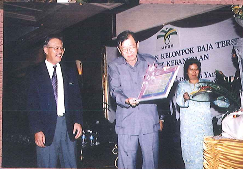
Pelancaran Skim Kelompok Baja Terselia peringkat kebangsaan oleh Y.B. Dato' Seri Dr Lim Keng Yaik pada 18 Ogos 2003.