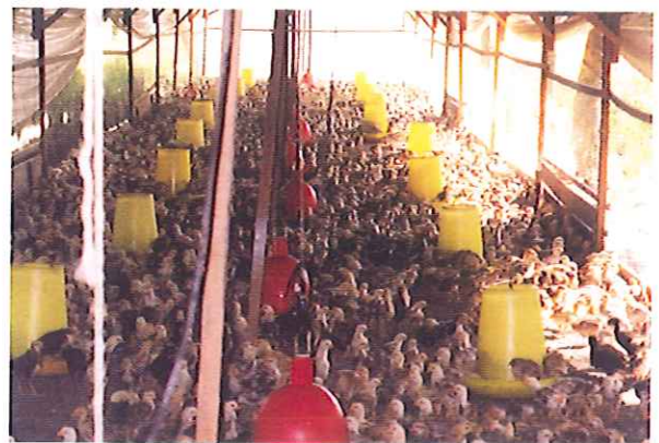
Ayam berada dalam reban selama 10-12 hari ▶