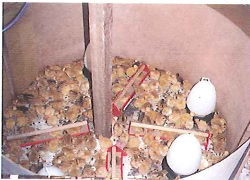
◀ Anak ayam dalam kurungan eraman selama lima hingga tujuh hari.

Ayam kampung mempunyai pasaran tersendiri. Walau bagaimanapun, harga ayam yang hendak dijual dipengaruhi oleh harga ayam pedaging. Harga ayam kampung hidup di ladang ialah antara RM 3.50 hingga RM 5/kg. Harga ayam kampung yang telah disembelih dan dibersihkan ialah antara RM 4.50 hingga RM 7/kg. Permintaan kepada ayam kampung bergantung pada lokasi. Adalah amat penting untuk memastikan ayam boleh dijual dengan harga yang baik sebelum memulakan projek. Salah satu cara yang boleh memastikan pasaran ialah melalui kaedah kontrak di mana kontraktor memastikan bekalan anak ayam dan memasarkan ayam yang telah cukup tempoh untuk jualan.