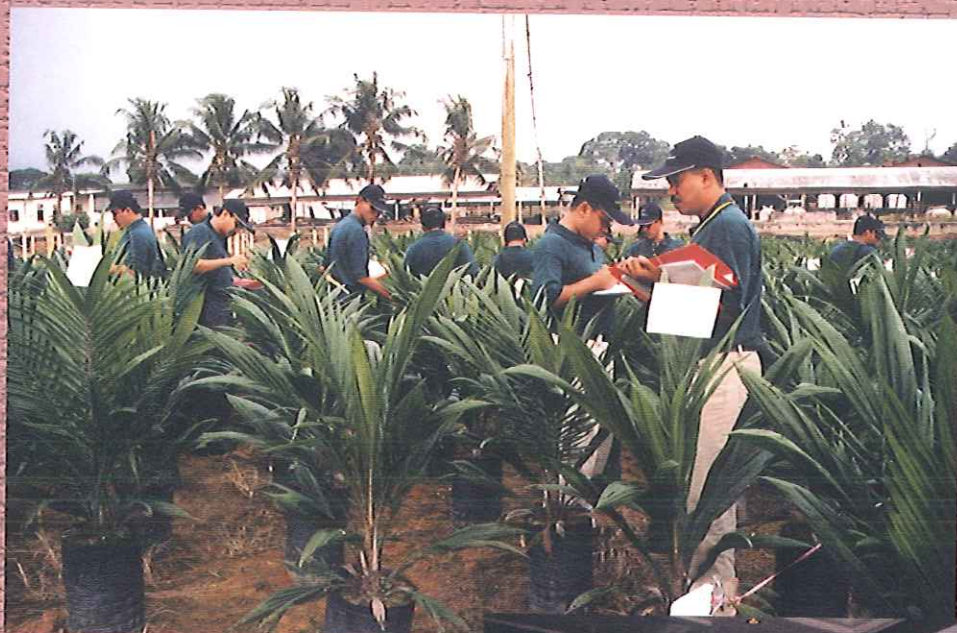
Pegawai Pelesenan dan Penguatkuasaan MPOB membuat penakalan benih sawit semasa Kursus Penilaian Tapak Semaian pada 24-26 Jun 2003.