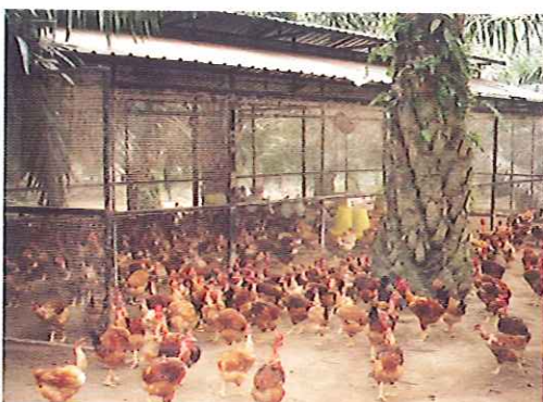
◀ Ayam sedia untuk dijual.