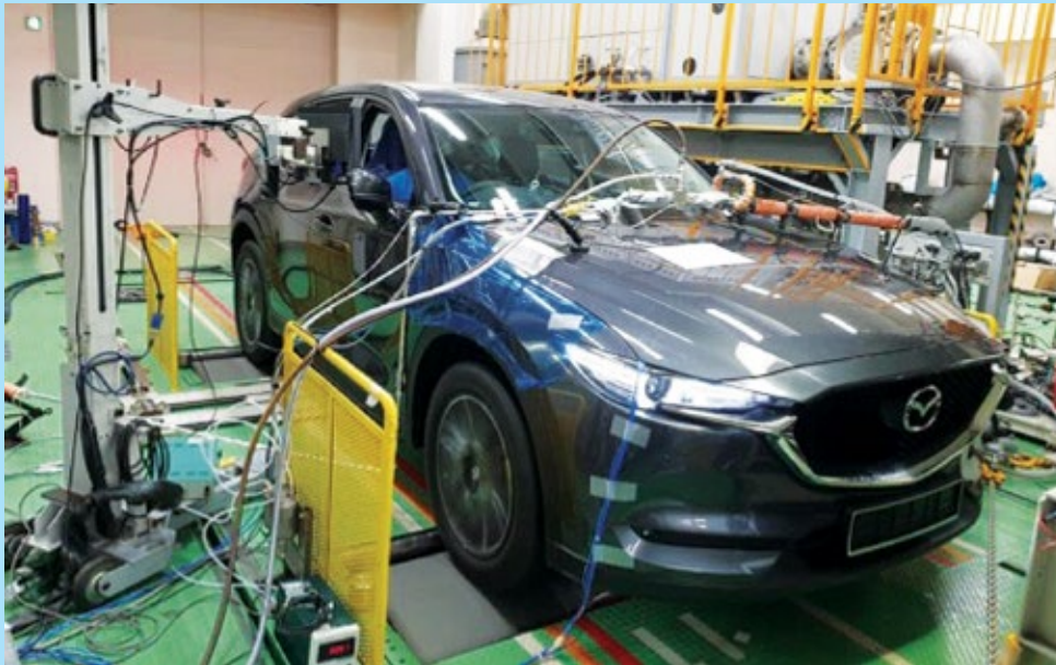
Rajah 4. Kenderaan uji kaji berteknologi Euro 5 menggunakan biodiesel sawit di makmal Institut Penyelidikan Automotif (JARI), Jepun.