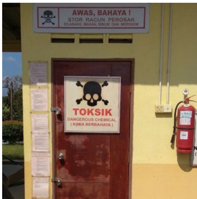
Rajah 2. Pengurusan stor simpanan bahan kimia dan racun perosak.

Pensijilan (EC) yang terdiri daripada ahli-ahli yang berpengalaman. Jika EC berpuas hati dengan hasil audit dan tindakan pembedahan yang diambil, mereka akan mencadangkan premis terbabit dianugerahkan dengan sijil CoPN. Jika sebaliknya, ahli mesyuarat akan meminta audit susulan dijalankan dengan fokus kepada isu-isu berbangkit sahaja.