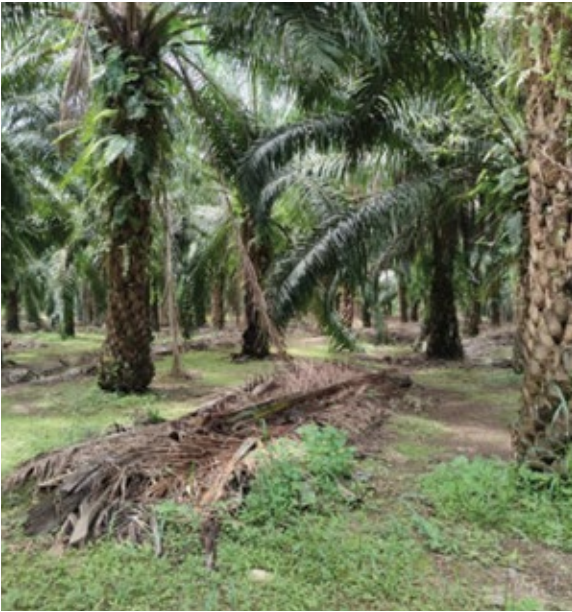
Rajah 3. Susunan pelepah di lorong pokok sawit.

setahun dengan kadar purata 9 kg/pk/thn dengan menggunakan baja sebatian yang mempunyai nisbah nutrien yang seimbang. Ini adalah berdasarkan pengalaman beliau dan panduan daripada pegawai TUNAS MPOB. Selain itu, beliau amat menitikberatkan keselamatan semasa bekerja seperti pemakaian peralatan perlindungan diri (PPE) dan penggunaan peralatan yang sesuai mengikut panduan dalam kriteria MSPO sewaktu menjalankan kerja-kerja di kebun.