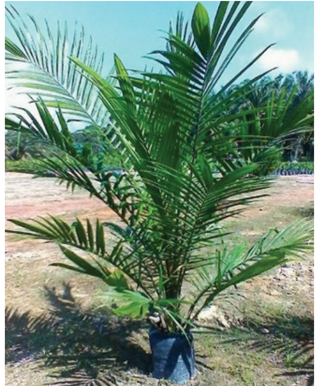
Rajah 1. Anak benih normal.

penghasilan anak benih sawit, semua aktiviti terbabit perlu dipantau dan diawasi melalui beberapa fasa pengauditan di mana semua amalan baik yang diamalkan akan dilaporkan di dalam laporan audit. Skop pensijilan CoPN meliputi aspek penyediaan bahan tanaman sawit di tapak semaian bermula daripada penerimaan biji benih cambah atau ramet sehingga ke peringkat sedia untuk penanaman di kebun atau ladang. Oleh itu, CoPN merupakan satu-satunya pensijilan yang terpakai khusus untuk pengusaha tapak semaian sawit di Malaysia.