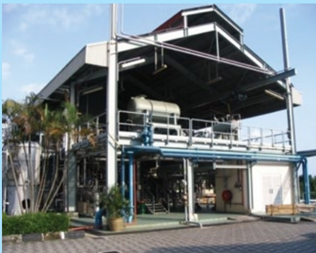
Rajah 1. Loji rintis biodiesel sawit pertama di Malaysia bertempat di Ibu Pejabat MPOB, Bangi.

Biodiesel adalah biobahan api mesra alam yang dihasilkan daripada minyak sayuran dan lemak haiwan melalui proses transesterifikasi. Sumber bahan mentah bagi penghasilan biodiesel di Malaysia adalah minyak sawit terproses. Menerusi penyelidikan dan pembangunan oleh MPOB semenjak 1980an, biodiesel sawit telah berjaya dibuktikan setanding dengan diesel petroleum dan boleh digunakan tanpa sebarang modifikasi kepada enjin kenderaan diesel (Choo et al. , 1997; 2005). Loji rintis biodiesel sawit pertama di Malaysia telah dibina di Ibu Pejabat MPOB pada 1985 (Rajah 1). Teknologi pengeluaran biodiesel