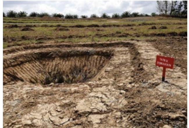
Rajah 5. Tempat pelupusan penakaian.