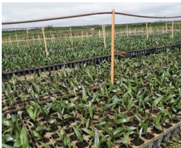
Rajah 3. Anak benih di tapak semaian kecil yang menggunakan pot trays.