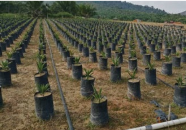
Rajah 4. Penggunaan polibeg bersaiz 15" x 18" dengan jarak tanaman 3' x 3' x 3'.