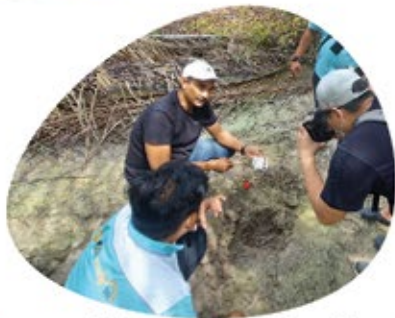
Khidmat Nasihat Teknikal Ladang