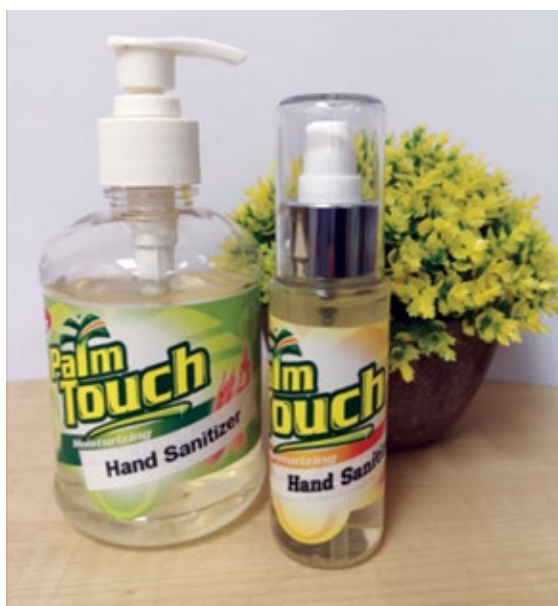
Rajah 1. Produk sanitasi tangan.

Produk sanitasi tangan ( hand sanitiser ) atau cecair pembasmi kuman digunakan pada tangan dengan tujuan menghapuskan organisma penyebab penyakit. Ia dikategorikan sebagai produk kosmetik dan biasanya berbentuk buih, gel atau cecair. Produk sanitasi tangan digunakan sekiranya tiada sabun dan air untuk membasuh tangan atau kegunaan sabun menyebabkan iritasi pada kulit sensitif. Produk ini mudah digunakan untuk mengawal jangkitan kuman di tempat awam seperti kedai, pusat membeli-belah, pusat jagaan kanak-kanak, sekolah sehinggalah di pusat perubatan seperti klinik dan hospital.