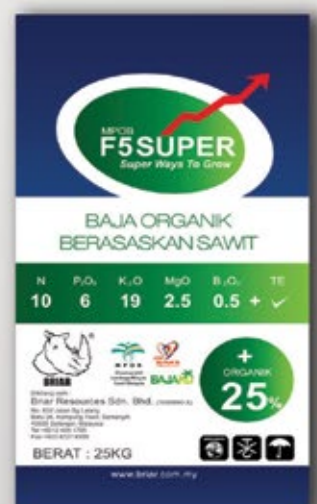
MPOB F5 SUPER