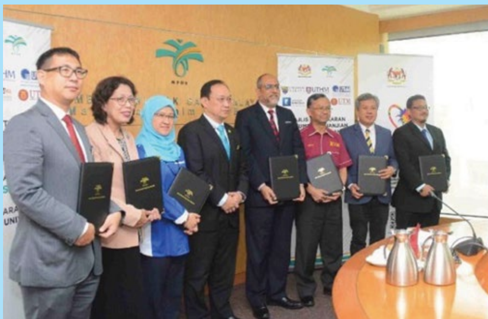
Rajah 3. Pertukaran dokumen perjanjian projek usaha sama kajian enjin diesel menggunakan biodiesel sawit B30 antara MPOB dan universiti pada 10 Oktober 2019 di Ibu Pejabat MPOB, Bangi.

Program Biodiesel Negara masih kekal relevan pada masa kini dan akan datang. Ini berkaitan dengan inisiatif penggunaan bahan api alternatif yang bersih bagi mengekalkan kelestarian alam sekitar yang akan diwarisi oleh generasi masa hadapan. Dari sudut ekonomi, penggunaan biodiesel sawit secara mandatori dapat mengekalkan kuantum penggunaan minyak sawit dalam negara yang mampu menyokong industri sawit mengatasi ketidakpastian pasaran dunia terutamanya tindakan sekatan terhadap biobahan api berasaskan minyak sawit oleh Kesatuan Eropah (EU) menjelang 2030. Program ini juga merupakan strategi masa panjang bagi memastikan pengukuhan dan kestabilan harga minyak sawit. Pembangunan industri sawit negara yang mampan dan berterusan akan membantu penyaraan kehidupan 650 000 pekebun kecil dan keluarga mereka.