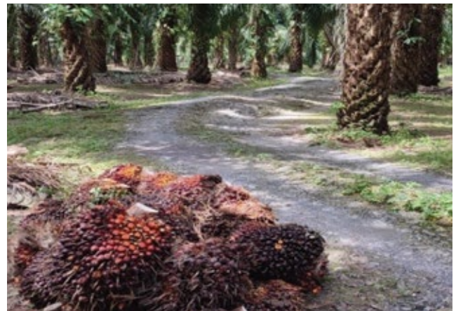
Rajah 2. Buah tandan segar yang baru dituai.

Keadaan kebun En. Lu mempunyai topografi tanah yang rata dan ini memudahkan kerja-kerja pembajaan dilakukan, di mana kaedah pembajaan adalah secara tabur rata terutama pada longgokan pelepah kerana terdapat akar-akar muda yang aktif untuk menyerap nutrien. Program pembajaan dilakukan sebanyak tiga kali