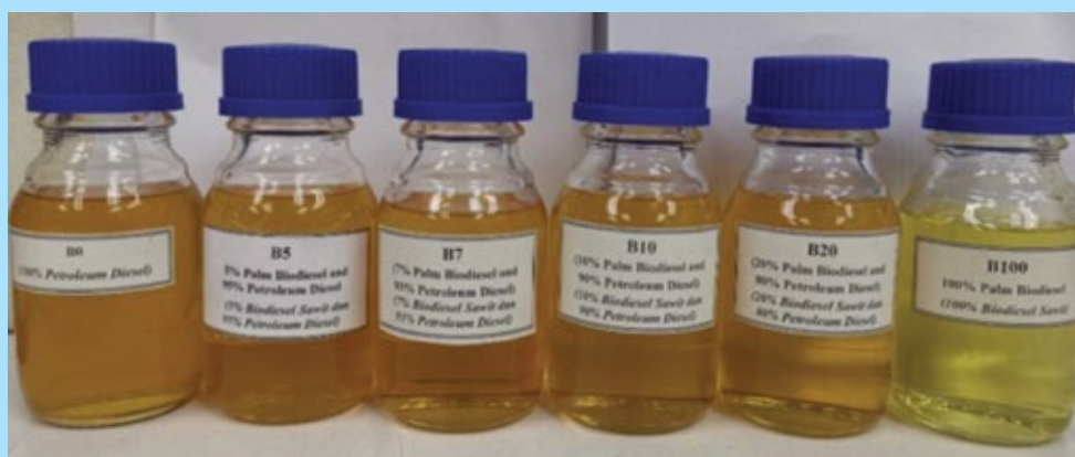
Rajah 2. Diesel petroleum B0, B5, B7, B10, B20 dan biodiesel sawit (B100).

Mengikut perkembangan penggunaan biodiesel sawit di Indonesia, Program B20 telah dilaksanakan secara mandatori semenjak Januari 2016 manakala Program B30 telah dilaksanakan pada Januari 2020 dengan tujuan untuk mengurangkan kebergantungan terhadap