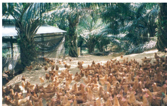
Rajah 7. Ayam dilepaskan pada waktu siang.

Peringkat pembesaran ialah ketika ayam berumur di antara 3-4 minggu hingga ia dijual. Bagi tempoh ini, ayam dilepaskan ke kawasan sawit yang berpagar pada waktu siang dan dibawa masuk ke dalam reban pada waktu malam ( Rajah 7 ). Pengurusan makanan, minuman, kebersihan dan kesihatan yang baik ketika ini akan menghasilkan pengeluaran yang maksimum. Pemberian makanan yang mencukupi mestilah dilakukan untuk menjamin tumbesaran yang optimum. Makanan ayam ditukar kepada makanan peringkat pembesaran ( poultry grower pellet ) secara berperingkat pada hari ke-29 dan pada hari ke-34 barulah diberikan makanan pembesaran sepenuhnya. Jadual 2 menunjukkan keperluan kuantiti makanan ayam pembesaran dari umur ayam 30 hingga 57 hari. Kuantiti makanan perlu dikawal kerana ia menyumbang 70% kepada keseluruhan kos pengeluaran. Jenis bekas dan ruang makanan perlu dipastikan mencukupi supaya semua ayam berpeluang mendapat akses makanan pada masa yang sama.