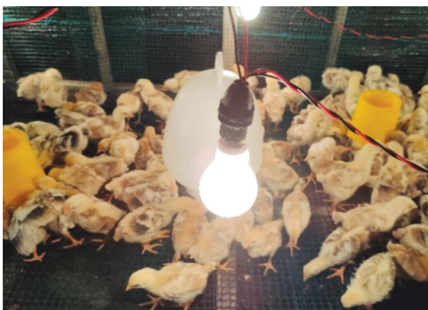
Rajah 6. Lampu pemanas untuk perindukan.

Bekas makanan dan minuman mestilah sesuai bagi ayam di peringkat perindukan. Lazimnya dulang digunakan sebagai bekas makanan untuk tempoh tiga hari pertama manakala bekas makanan ayam automatik ( automatic bird feeder ) dengan kapasiti 1 kg pula boleh digunakan sehingga anak ayam berumur sebulan. Bekas makanan dan minuman hendaklah dipastikan mencukupi dengan jumlah anak ayam supaya tiada persaingan untuk mendapatkan makanan