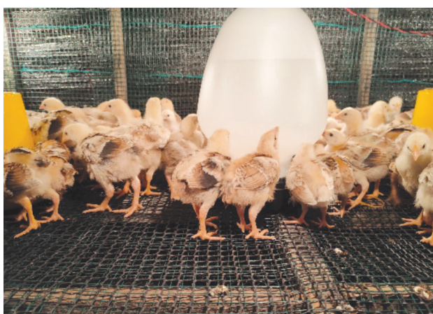
Rajah 5. Anak ayam yang sihat.

Pada minggu kedua, bekalan haba hanya diberikan pada waktu malam sahaja. Setelah anak ayam berusia 10-12 hari, kepungan perindukan boleh dibuka dan anak ayam dilepaskan ke kawasan reban utama. Anak ayam juga mula dilepaskan keluar dari reban pada waktu siang dan dimasukkan semula pada waktu malam.