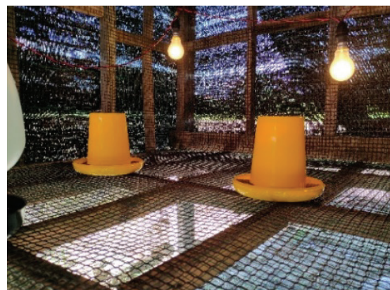
Rajah 4. Reban kecil perindukan.

Sebelum anak ayam yang dipesan tiba, alat pemanas hendaklah dihidupkan terlebih dahulu sekurang-kurangnya 12 jam supaya suhu kawasan perindukan sesuai dengan suhu badan anak ayam. Apabila anak ayam tiba di reban, ia perlu dikira bagi menentukan jumlah sebenar dan mengenal pasti tahap kesihatan ( Rajah 5 ). Kemudian anak ayam mestilah terlebih dahulu diberi minum air minuman yang dicampur dengan anti-stres bagi meminimumkan impak stres ke atas ayam. Makanan jenis pemula ( starter ) hendaklah disediakan di dalam dulang makanan dua jam selepas anak ayam minum air. Kuantiti makanan yang disediakan tidak boleh terlalu banyak bagi mengelakkan pembaziran kerana ia mungkin akan dicemari oleh tinja. Lazimnya, anak ayam akan terus makan dan minum sebaik sahaja dilepaskan di kawasan perindukan. Anak ayam yang mati perlu dilupuskan manakala yang lemah diasingkan daripada kumpulan. Air minuman perlu diganti setiap hari dan dipastikan sentiasa mencukupi.