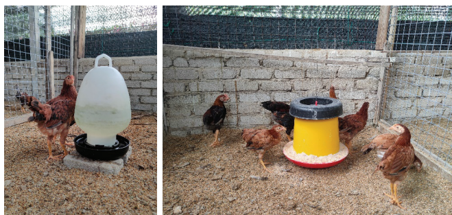
Rajah 8. Bekas makanan dan minuman.

Lazimnya, ayam akan minum dua kali ganda daripada jumlah berat makanan yang dimakan. Semasa keadaan cuaca panas, ayam juga akan minum dua kali ganda berbanding cuaca (suhu) biasa. Penggunaan bekas minuman gantung automatik boleh memudahkan pengurusan bekalan air. Ruang makan yang perlu disediakan bagi setiap ekor ayam adalah 2 cm dan pH air yang ideal bagi pemeliharaan ayam pula adalah di antara pH 6.5 hingga 8.0 (Rajah 8).