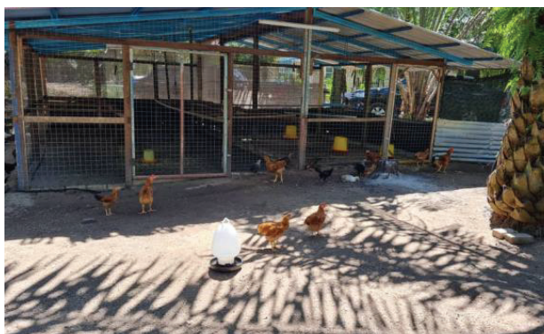
Rajah 2. Contoh reban ayam model integrasi dengan sawit.

Reban ayam dibina berlantakan tanah manakala dinding reban dibina dengan menggunakan batu bata setinggi 0.1 m dari paras tanah. Dinding di bahagian atas dibina dengan menggunakan BRC daripada dawai tebal. Ketinggian reban dari paras tanah ke bumbung ialah 3.0 m. Tiang reban dibina menggunakan tiang batu/ kayu/ C-Channel. Atap reban pula dibina menggunakan metal deck . Reban ayam yang dibina mestilah lengkap bersama dengan peralatan asas yang diperlukan untuk penternakan ayam.