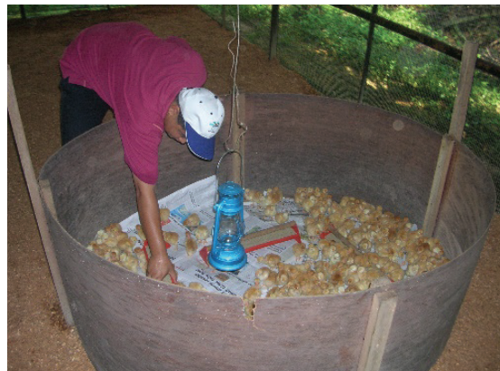
Rajah 3. Kepungan perindukan.

yang berwibawa dan berdaftar dengan Jabatan Perkhidmatan Veterinar. Anak ayam yang baru sampai perlu diuruskan dalam sistem perindukan yang baik. Peringkat perindukan amat penting dalam proses awal pemeliharaan. Ia memerlukan perhatian teliti bagi merendahkan kadar kematian anak ayam.