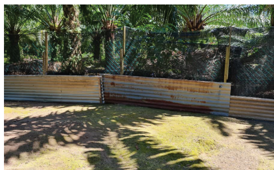
Rajah 1. Pagar perimeter kawasan.

Model penternakan integrasi ayam kampung dengan sawit yang disyorkan ialah 1000 ekor ayam dalam kawasan seluas 0.4 ha (bersamaan satu ekar). Kawasan yang dipilih perlu bersih daripada anak kayu dan rumpai khususnya di sempadan plot untuk pembinaan pagar. Pagar sempadan perlu dipasang bagi memastikan ternakan selamat dan mudah dikawal serta terhindar daripada kehilangan. Bahan binaan yang sesuai untuk membina pagar sempadan termasuklah tiang daripada konkrit atau kayu keras dan pagar ( chain-link , pukut pertanian atau zink). Ketinggian pagar dicadangkan adalah sekurang-kurangnya 1.8 m dari permukaan tanah. Pemasangan zink pada bahagian bawah pagar disyorkan bagi mengelakkan serangan babi hutan, anjing dan biawak ( Rajah 1 ).