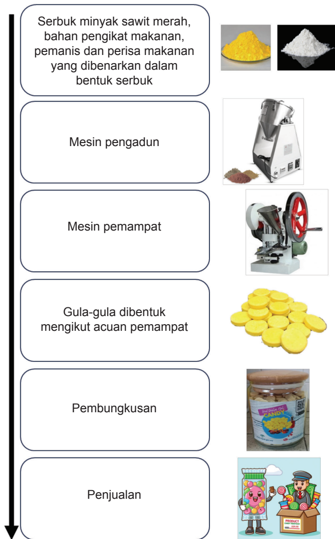
Rajah 3. Proses pembuatan gula-gula minyak sawit merah.

Proses pembuatan gula-gula MSMH boleh diterangkan secara ringkas dalam Rajah 3 . Proses bermula dengan pencampuran bahan-bahan seperti serbuk MSMH, bahan pengikat makanan, pemanis, perisa makanan dan bahan tambahan makanan yang lain. Selepas itu, bahan campuran tersebut akan dimampatkan dan dibentuk mengikut acuan. Akhir sekali, gula-gula MSMH yang telah siap dibungkus di dalam botol sedia untuk dipasarkan. Produk ini perlu disimpan pada suhu dingin serta tidak terdedah kepada cahaya matahari dan kelembapan supaya kandungan nutrisinya terjamin.